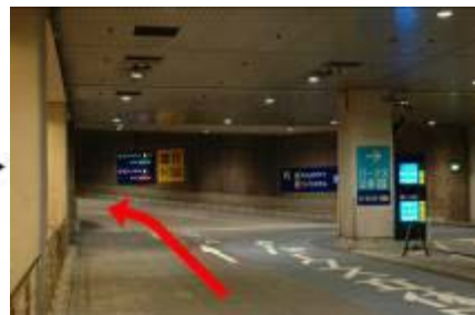
3. 駐車場内分岐にて左へ