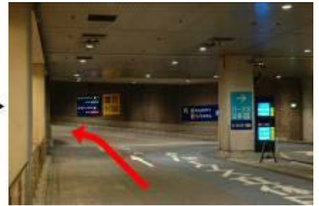
3. 駐車場内分岐にて左へ